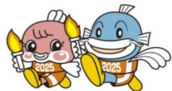
2025 年わた SHIGA 輝く国スポ・障スポ キャラクター チャッフィー キャッフィー

いなべ東近江ラリー2021 は、2021 年の三重とこわか国体と 2025 年わた SHIGA 輝く国スポ・障スポ を応援しています！