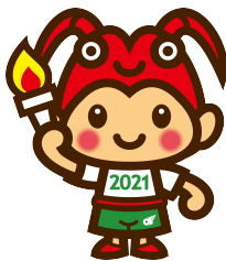
2021 年三重とこわか国体 キャラクター とこまる