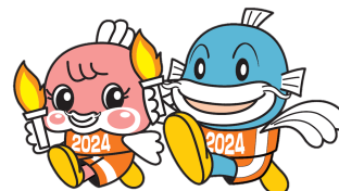
2024 年滋賀国体 キャラクター チャッフィー キャッフィー

いなべ東近江ラリー2019 は、2021 年の三重とこわか国体と 2024 年の滋賀国体を応援しています！