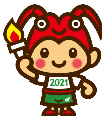
2021 年三重とこわか国体 キャラクター とこまる